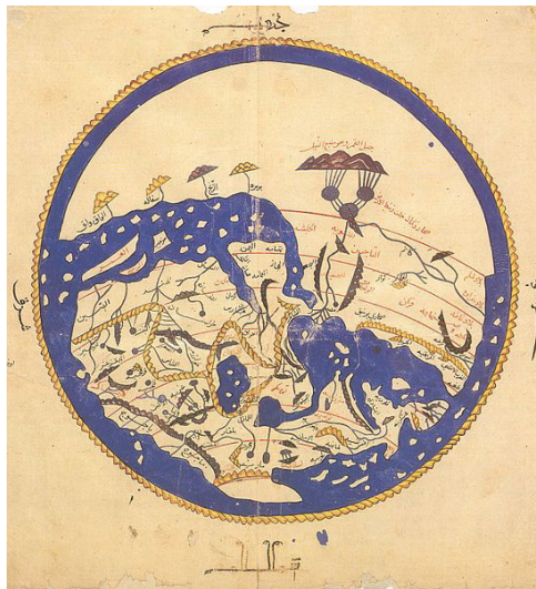
Cuadro 1: Al-Idrisi, Nuzhat al-mushtaq fi ikhtirâq al-Afaq (Viaje de alguien que está dispuesto a atravesar horizontes)

A l-Ándalus es el llamado “tiempo dorado” de la presencia musulmana en Europa que cubre geográficamente el área de la Península Ibérica y algunas islas del Mediterráneo como Creta, Sicilia y las Baleares. En 711, el líder árabe Musa Ibn Tariq, que había conquistado previamente el norte de África y los pueblos bereberes, cruzó con sus tropas el Estrecho de Gibraltar y ocupó el reino de los visigodos. Al-Ándalus se convirtió en un objeto de la glorificación romántica. Hasta hoy en día, especialmente en el mundo árabe prevalece el mito de una España morisca, donde existía un multiculturalismo ampliamente desarrollado. Las ciudades de Córdoba y Granada se convirtieron en centros culturales y económicos de primer nivel tanto en la región Mediterránea como en el Mundo Islámico. Fueron en el siglo X las ciudades más grandes de Europa. Este mito contrasta con la imagen de la Iglesia católica intolerante y agresiva después de la llamada reconquista que culminó en el establecimiento de la Inquisición y la expulsión de los musulmanes restantes.