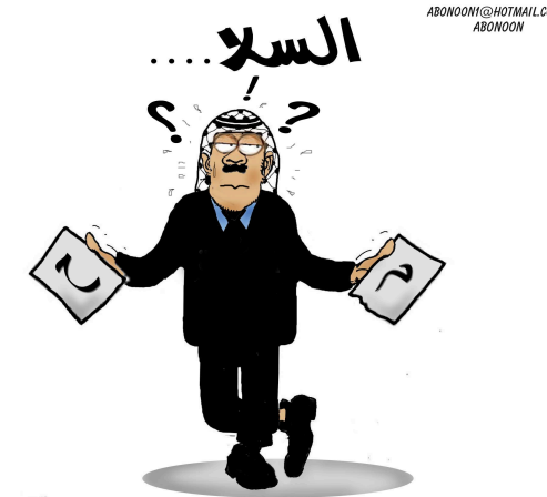
Cuadro 3: ¿ As-Salam (Paz) o As-Saleh (armas)?

proyecto fueron presentados a un nutrido público que representaba los dos movimientos políticos importantes del pueblo palestino (Hamas y Fatah).